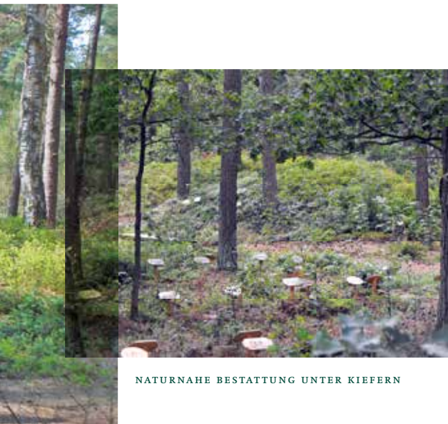
NATURNAHE BESTATTUNG UNTER KIEFERN

Der Abschiedswald ist kein herkömmlicher Friedhof, sondern Wald im gesetzlichen Sinn. Die Grabpflege bleibt der Natur überlassen.