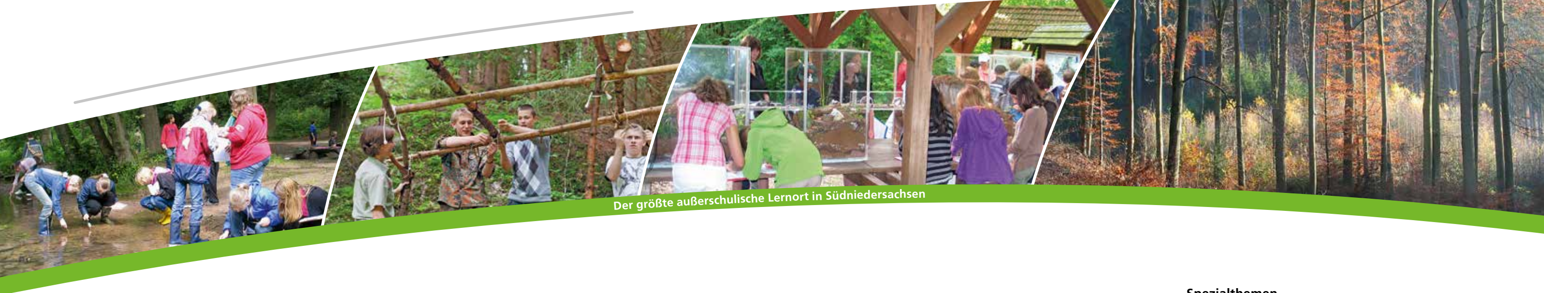
Der größte außerschulische Lernort in Südniedersachsen