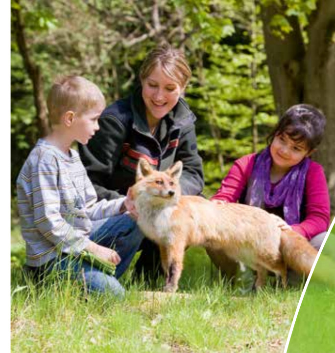
Natur mit allen Sinnen erleben, Grundlagenkenntnisse heimischer Tier- und Pflanzenarten erlangen und weitergeben

Die Fortbildung ist so terminiert, dass sie innerhalb von einem Jahr absolviert werden kann. Die Teilnehmerinnen und Teilnehmer erhalten nach erfolgreich bestandener Prüfung eine Urkunde als „Zertifizierte Waldpädagogin“ oder „Zertifizierter Waldpädagoge“, welche bundesweiten Qualitätsstandards entspricht.