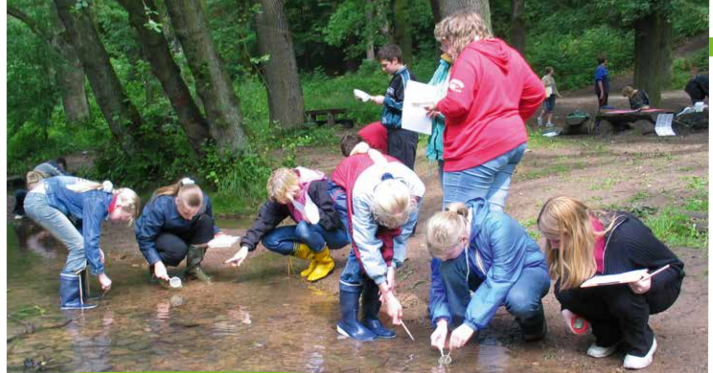
Bei uns steht nicht die „trockene Wissensvermittlung“ im Vordergrund, es geht vielmehr darum, den Wald erlebbar zu machen