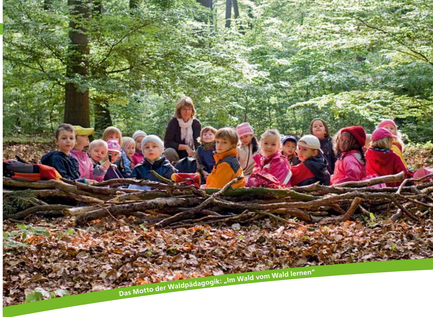
Das Motto der Waldpädagogik: „Im Wald vom Wald lernen“