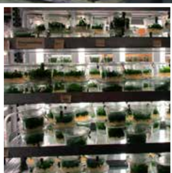
VERMEHRUNG DER MIKRO-STECKLINGE IM GLAS AUF NÄHRSUBSTRAT