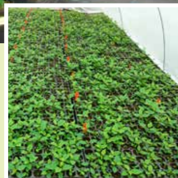
ETABLIERUNG DER MIKRO-STECKLINGE IN ERDE UND LANGSAME ABHÄRTUNG IM GEWÄCHSHAUS