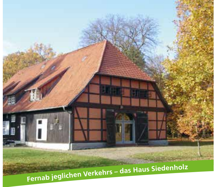
Fernab jeglichen Verkehrs – das Haus Siedenholz