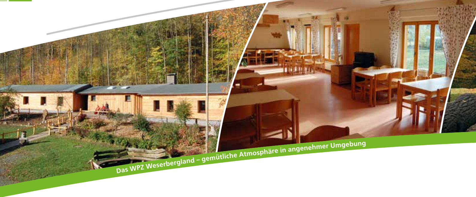
Das WPZ Weserbergland – gemütliche Atmosphäre in angenehmer Umgebung