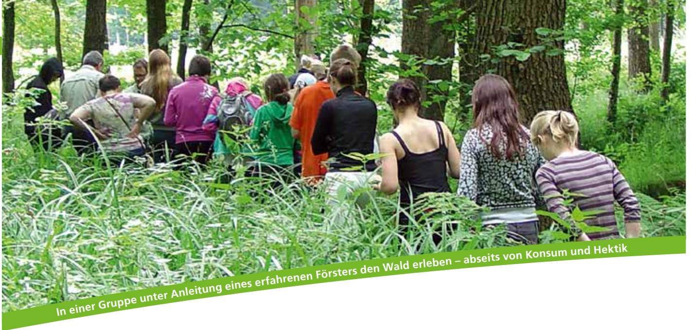
In einer Gruppe unter Anleitung eines erfahrenen Försters den Wald erleben – abseits von Konsum und Hektik