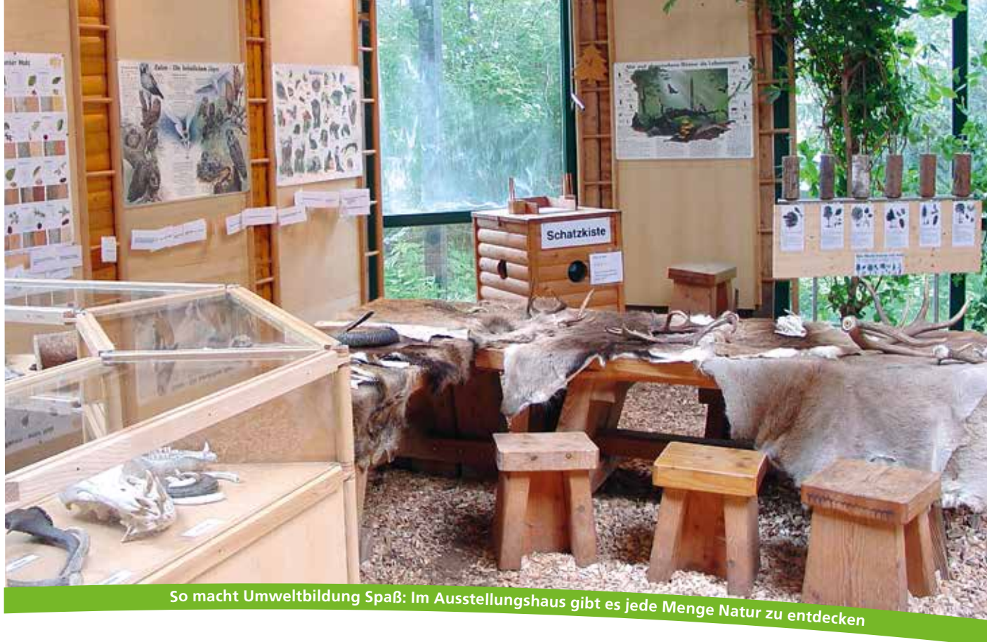
So macht Umweltbildung Spaß: Im Ausstellungshaus gibt es jede Menge Natur zu entdecken