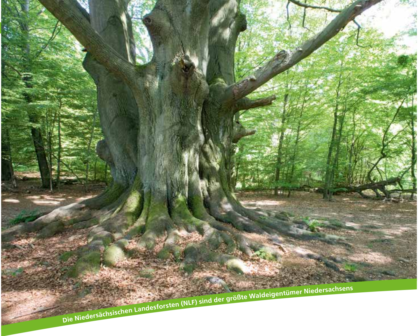
Die Niedersächsischen Landesforsten (NLF) sind der größte Waldeigentümer Niedersachsens