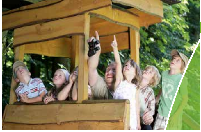
Im Waldforum Riddagshausen warten viele Abenteuer – nicht nur auf kleine Entdecker

Einrichtung, Angebote, Wirkungsbereich Das Waldforum Riddagshausen ist in einem alten Fachwerkhaus in Riddagshausen (Braunschweig) am Rande eines großen Naturschutzgebietes, dem alten Eichen-Hainbuchen Wald Buchhorst, untergebracht. Im Waldforum finden Sie eine Multimediaausstellung zur Nachhaltigkeit und eine Wald-Mediothek, in der über alle Waldthemen informiert wird. Für unvergessliche Kindergeburtstage und andere waldpädagogische Veranstaltungen stehen urige Waldhütten zur Verfügung.