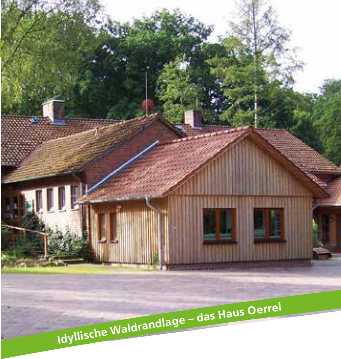
Idyllische Waldrandlage – das Haus Oerrel