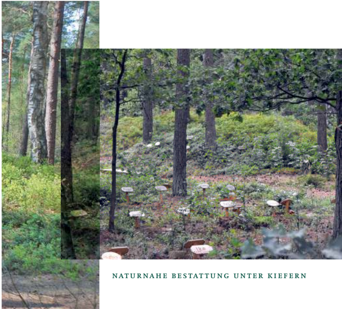
NATURNAHE BESTATTUNG UNTER KIEFERN

Der Abschiedswald ist kein herkömmlicher Friedhof, sondern Wald im gesetzlichen Sinn. Die Grabpflege bleibt der Natur überlassen.