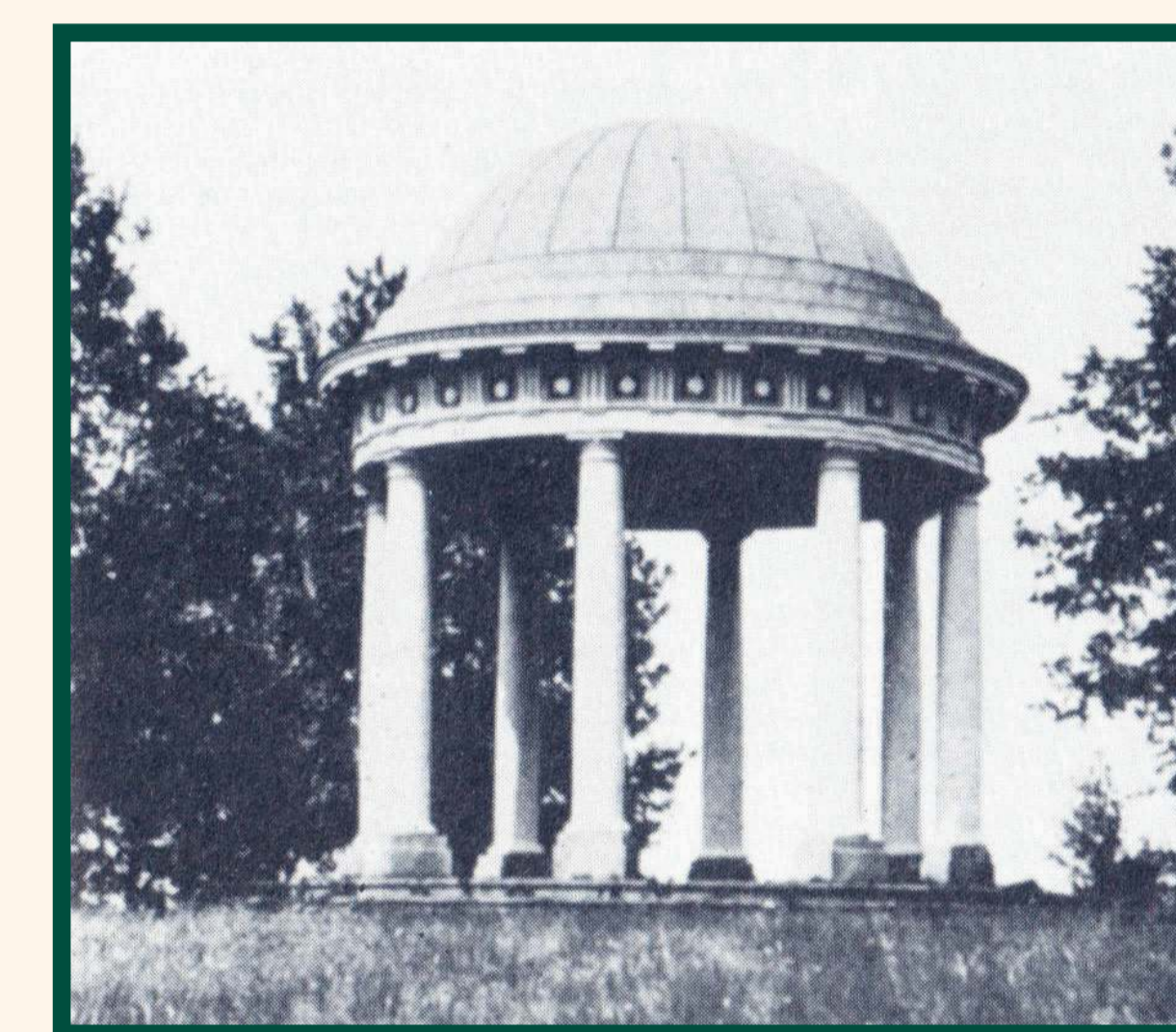
Zurzeit von Philippine Charlotte wurden dem Zeitgeschmack entsprechend Elemente des englischen Landschaftsgartens in den herrschaftlichen Wald eingefügt: Ein Rundtempel „Karls-Ruhe“ 10 – ihre vorgesehene Grablege, aber auch ein Bauernhaus im Fachwerkstil, verschiedene geschlängelte Wegführungen (sogenannte Englische Wege), ein „Bowling Green“ 11