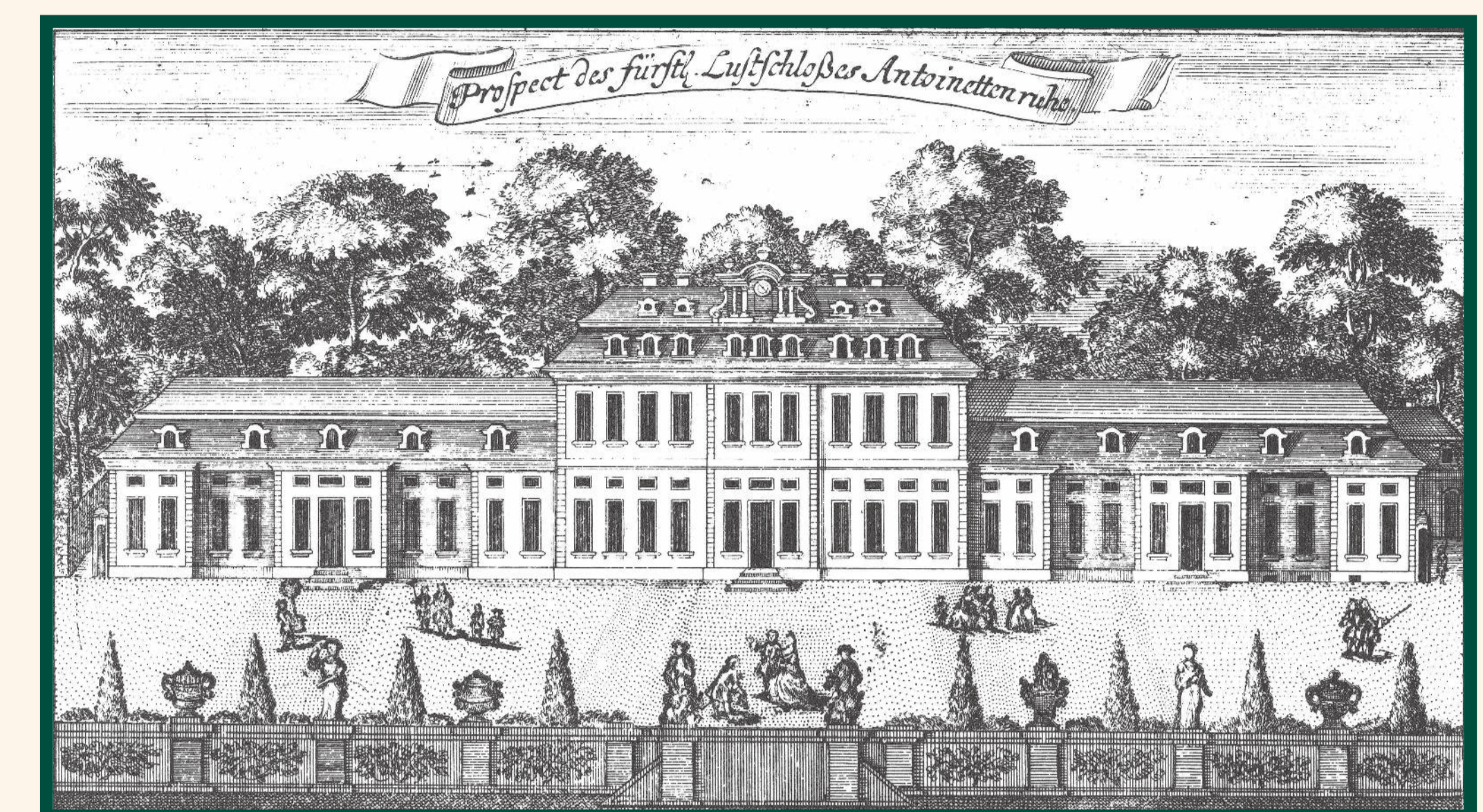
Schloss Antoinettenruh 7 Kupferstich von A. A. Beck“ um 1735